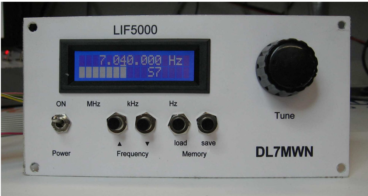
Bild 1 Das analoge und digitale S-Meter