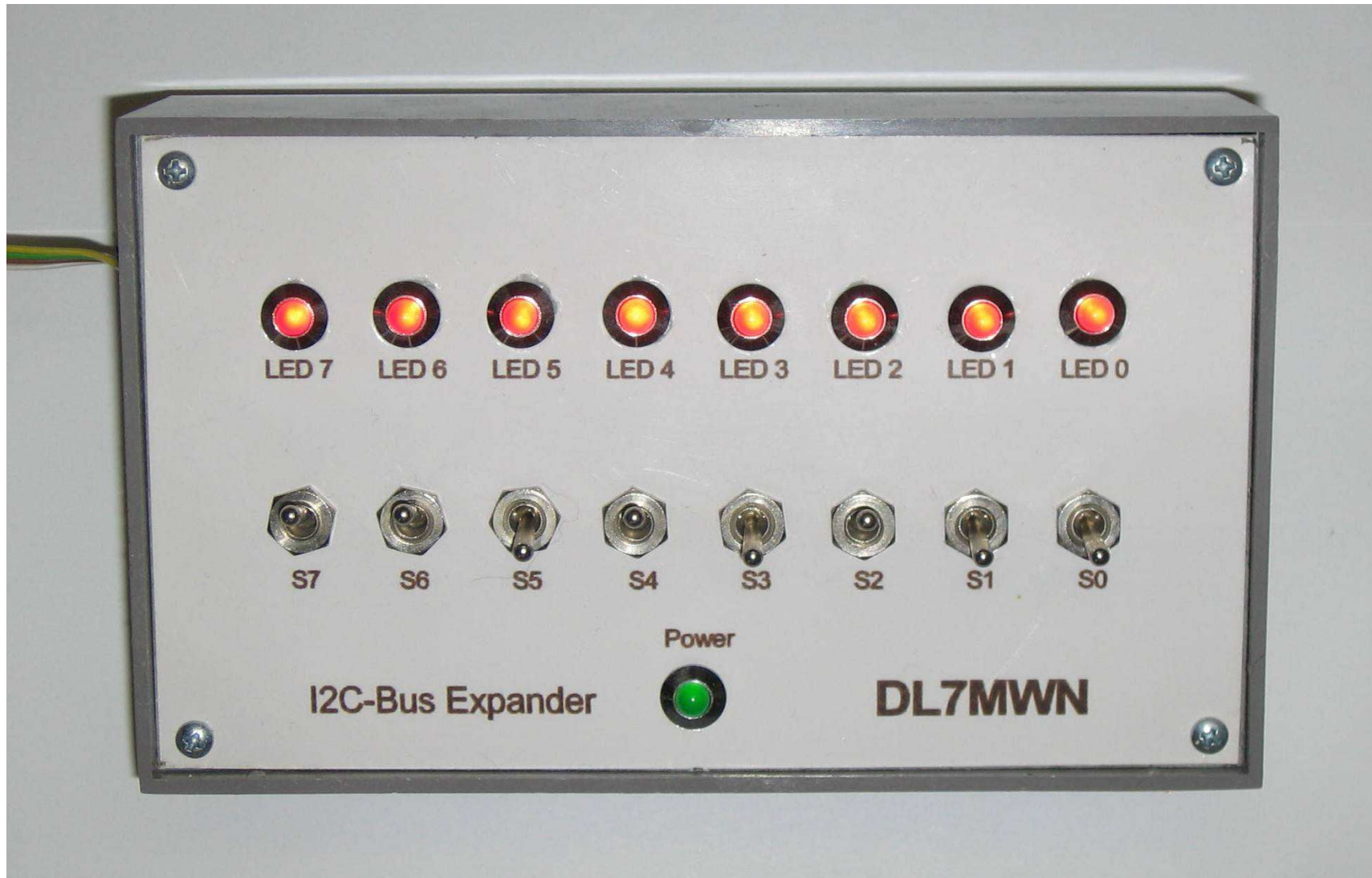
Bild 5 Das ist die Testschaltung für den I2C-Bus